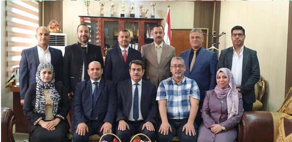
مجلس كلية الطب البيطري